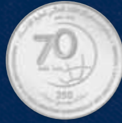
القطعة النقدية التذكارية من إصدار بنك المغرب ⵏⴰⵙⴰⵏⴰ ⵏ ⵓⵙⵓⵔ ⵏ ⵏⵉⵔⵉⵏⵉ ⵏ ⵏⵉⵙⵓⵔ ⵏ ⵏⵉⵙⵓⵔ La pièce de monnaie commémorative émise par Bank Al Maghrib