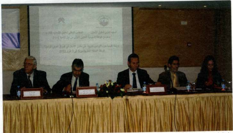
Organisée par le CNDH et l'Institut arabe des droits de l'Homme, la conférence régionale autour de l'éducation et de la formation aux droits de l'Homme a débuté ses travaux jeudi à Rabat.

Si il y avait une leçon à tirer de la période du Printemps arabe, ce serait que la liberté ne se donne pas, mais se prend. Dans son sillage, elle traîne des droits de l'Homme qui ont été longtemps bafoués, à des degrés différents et selon chaque pays.