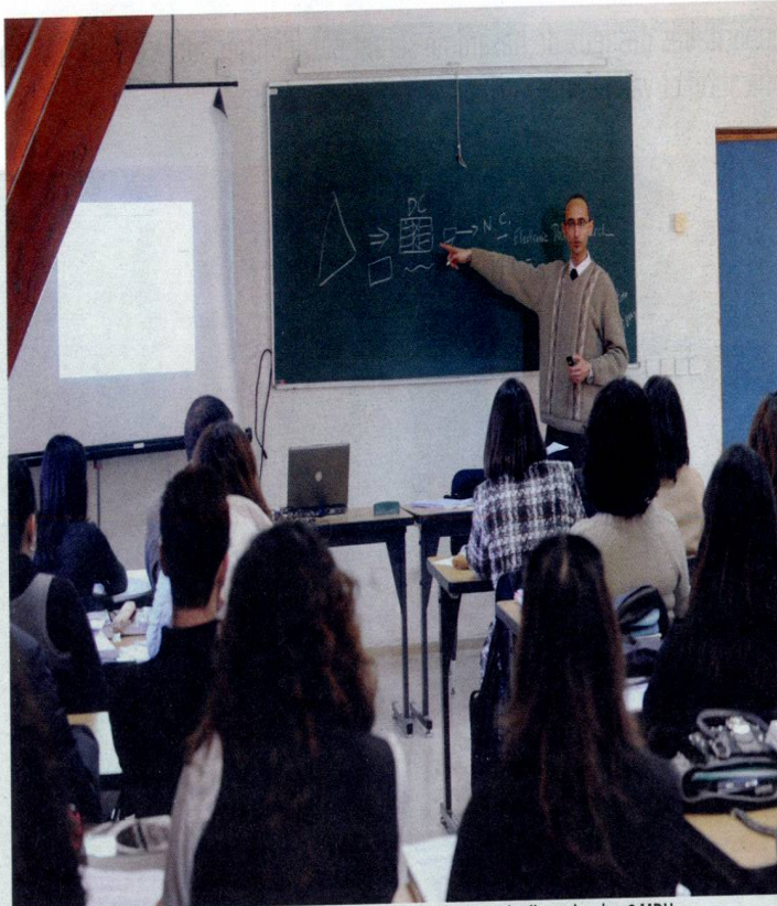
Al Akhawayn bénéficie d'une subvention de 25 MDH alors que l'ISA se voit allouer à peine 6 MDH.