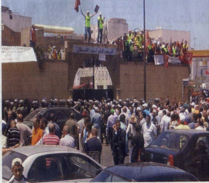
محاولة اقتحام مقر حزب الاستقلال لتحريره من المعطلين

وقد أكد المحتجون أن ما ارتكبه حزب الاستقلال في حقهم «نقطة سوداء» في تاريخ حزب يدعي النضال من أجل المعطلين، من جهتها، أكدت الشبيبة الاستقلالية، في بيان لها حصلت «المساء» على نسخة منه، إدانتها بقوة احتلال المركز العام لحزب الاستقلال، باعتباره مقرا لهيئة حزبية غير حكومية، لا يجوز لأي من كان التطاول عليه أو الإساءة إليه، كما أكد البيان على أن شبيبة الحزب تعزز «بالمجاهدات الخبارة» للحكومة الحالية التي يقودها حزب الاستقلال في مجال تشغيل حاملي الشواهد العليا غير المسوقة في تاريخ تعاطي الحكومات المغربية مع إشكالية البطالة، كما نددت الشبيبة الاستقلالية في بيانها بالاستغلال السياسي لمجانة حاملي الشواهد العليا وتحملهم مسؤولية السقوط في فخ التوظيف السياسي لملف اجتماعي، وعابنت «المساء» عدة محاولات لتكتم أفواه الصحفيين الحاضرين لتغطية الحدث، حيث تم الاعتداء بالضرب على الصحفيين أكثر من مرة، ومحاولة الاستيلاء على آلات التصوير حتى لا يتم تصوير الخروقات التي عرفها الصدام المهاجمون هدفهم من هذا الفعل ولا خلفياتهم.