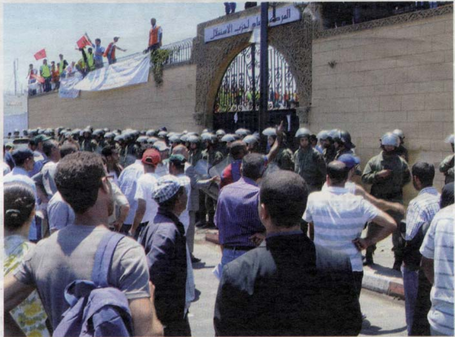
Des diplômés chômeurs qui manifestaient leur colère devant le siège de l'Istiqlal depuis le 13 juillet, ont été évacués mercredi soir par la police.

« L'engagement fort de la commission du dialogue que nous serons tous embauchés en 2012 », confie, sous couvert d'anonymat une membre de la coordination. Cette promesse comprend également les protestataires qui n'obtiendront leurs diplômes que cette année, à condition qu'ils aient soutenu en 2011. Au lieu de résoudre le problème, nos officiels n'ont donc fait que le reporter. Argument : la loi de finances de cette année ne prévoit nullement des postes budgétaires pour ces nouveaux manifestants qui se sont constitués après la publication au