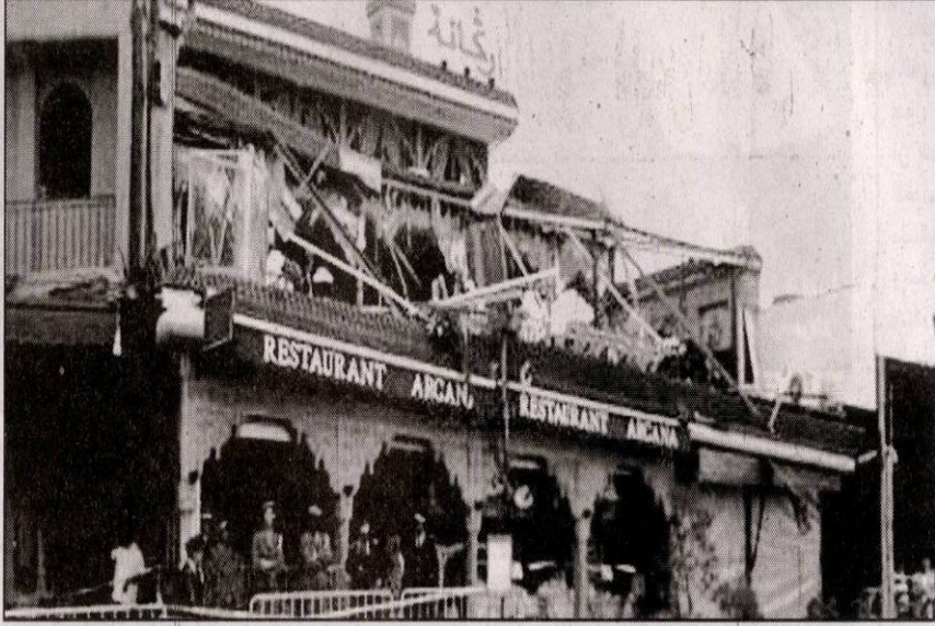
مطعم أركانة الذي استهدفه الإرهابيون

هذه الاعتداءات التي نفذت ضدهم بمعوية عناصر العائلة في بيانها تقول إن ابنها قرر الدخول للفسحة القانونية. وتطالب بتمتع ابنها ببذل خضراء ، كما تشهد على ذلك ولاحظته في إضراب عن الطعام احتجاجا على معاملات ومن معه بكافة الحقوق التي تضمنها القانون رئيس الحي والتقليص المتواتر والمقصود والدستور للسجين أيضا، عائلته لدى زيارته مؤخرا .