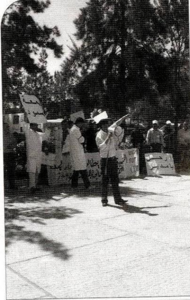
وقف احتجاجية على تردى الخدمات الصحية

الحراسة في المركز أقدم على اقتحام لمصلحة الطب العام و الجراحة من النافذة في ساعة متأخرة من الليل، قصد تقديم مشروب تجهل محتوياته لمريض أجريت له عملية جراحية في نفس اليوم، قد تكون له عواقب وخيمة على صحته بيد أن الإدارة -يمضي المحتجون- التجأت إلى استدعاء فرقة من الأمن الوطني لاستنطاق الممرضة كما حدث إغماء مصطنع لإحدى عاملات النظافة، قصد تليفق تهمة واهية لا أساس لها من الصحة ضد الممرضة، وتقني صيانة بالمستشفى المذكور، وهو يحمل صفة الكاتب الإقليمي لفرع الجامعة الوطنية لقطاع الصحة المنصوية تحت لواء الاتحاد الوطني للشغل بالمغرب، مازال متابعا أمام القضاء ويقولون إن قضيته كانت «مفتعلة». غضب المحتجين امتد ليشمل ما تم اعتباره "تراجعا خطيرا في جودة الوجبات الغذائية المقدمة للموظفين والمرضى، وذلك في غياب لجنة تسليم المواد الغذائية المنصوص عليها في دفتر التحملات".