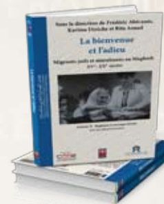
La bienvenue et l'adieu Volume II : Ruptures et recompositions