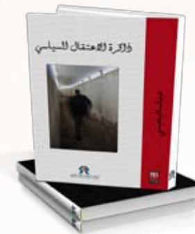
Mémoire de la détention politique Abdeslam Benaissi. Arabe