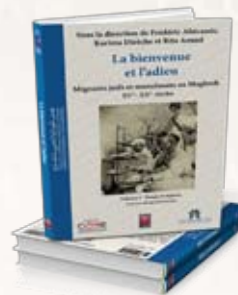
La bienvenue et l'adieu Volume I : Temps et espaces