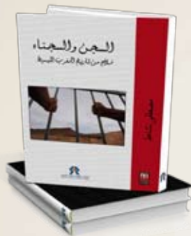
Prison et prisonniers. Quelques cas de l'histoire du Maroc médiéval Mustapha Nashat. Arabe

Dans le cadre de ses activités, le Conseil national des droits de l'Homme édite annuellement une dizaine de publications : rapports annuels sur la situation des droits de l'Homme, rapports thématiques, actes de séminaire, études, etc. Le CNDH publie en parallèle des ouvrages traitant de différents aspects de la problématique des droits de l'Homme. Les titres publiés en 2012 (aux éditions La Croisée des chemins) sont présentés à l'occasion de cette 18 ÈME édition du SIEL.