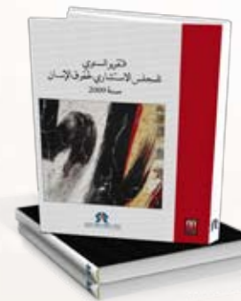
Rapport annuel du Conseil consultatif des droits de l'Homme 2009