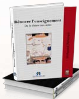
Rénover l'enseignement. De la Charte aux actes Mohamed Berdouzi. Français