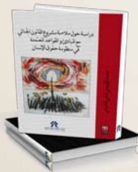
L'harmonisation du projet de Code pénal avec les principes et les règles du droit international des droits de l'Homme Mohamed Idrissi Alami Machichi. Arabe