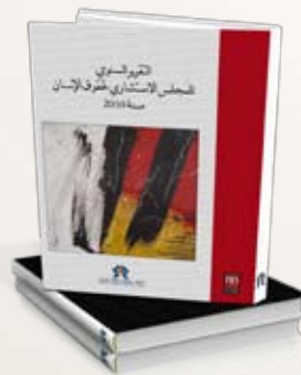
Rapport annuel du Conseil consultatif des droits de l'Homme 2010