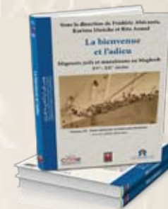
La bienvenue et l'adieu Volume III : Entre mémoire et nouveaux horizons